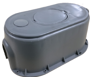
Mẫu hộp số 1