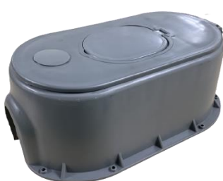
Mẫu hộp số 1